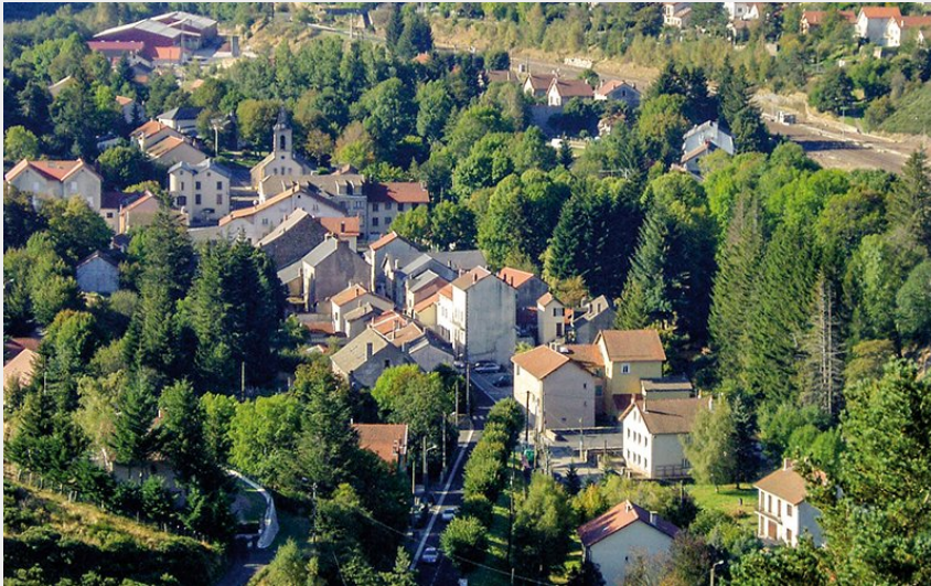
La Bastide-Puylaurent