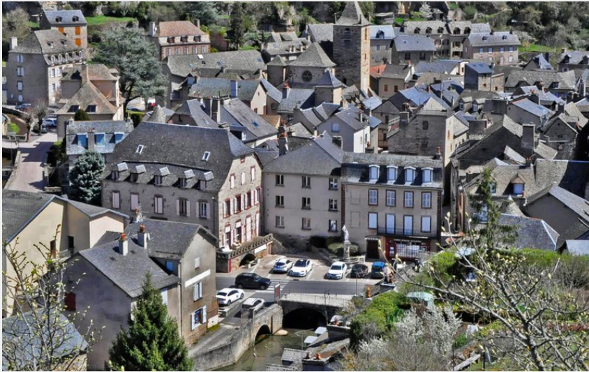
Vue sur la Canourgue