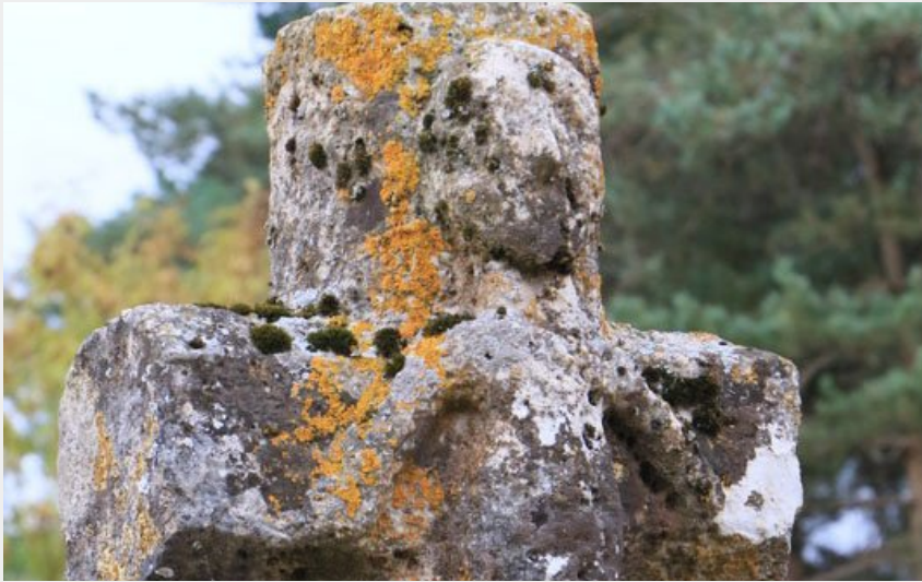
Croix ouvragé sur le GR 60 leSaint guihem (Léon Troucellier)