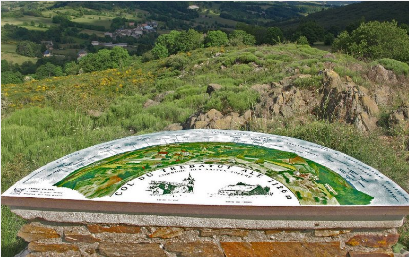
La vue panoramique depuis le col du Trébatut (OT de l'Aubrac aux Gorges du Tarn)