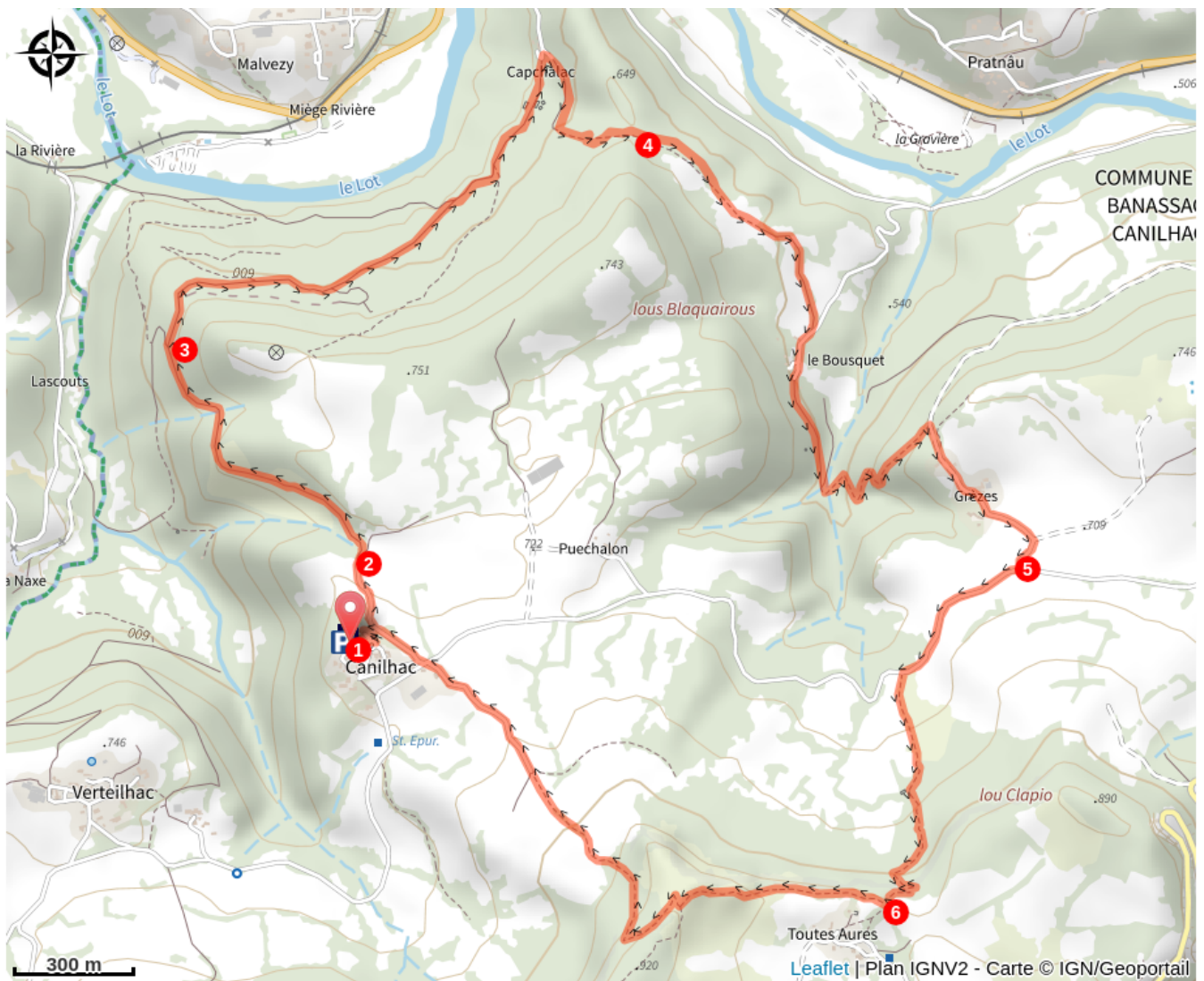
Château de Canilhac (A)