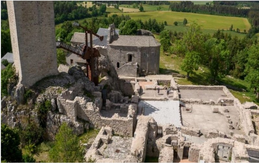
Tour d'Apcher (Benoît Coulomb)