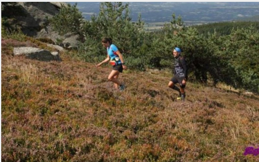
Trail Margeride