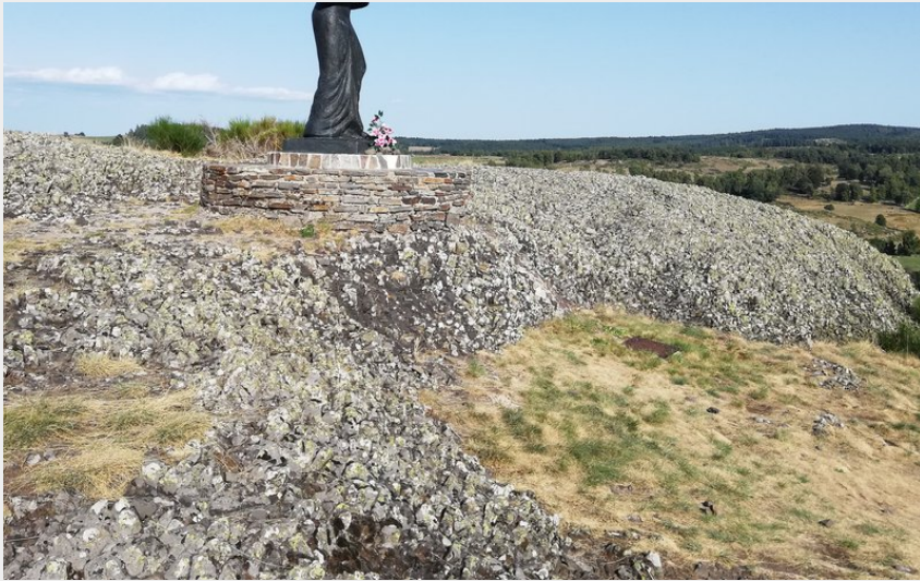
Rocher du Cheylaret (OT Aubrac Lozérien)