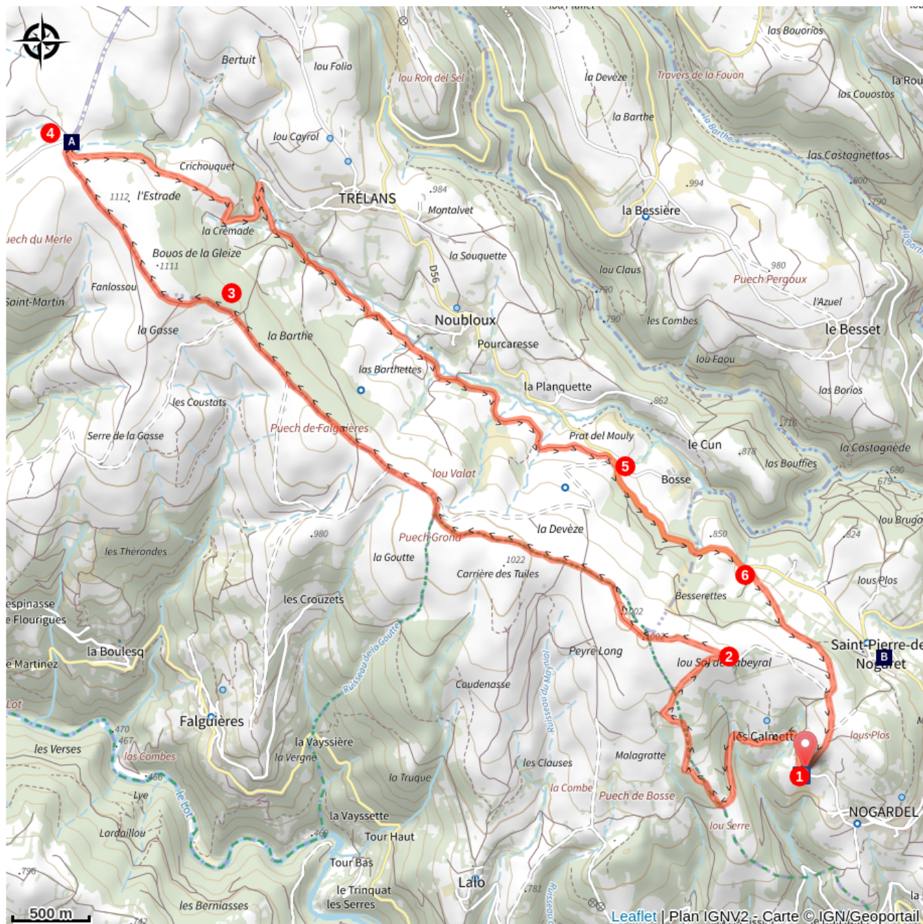
La Croix du Pal (A)