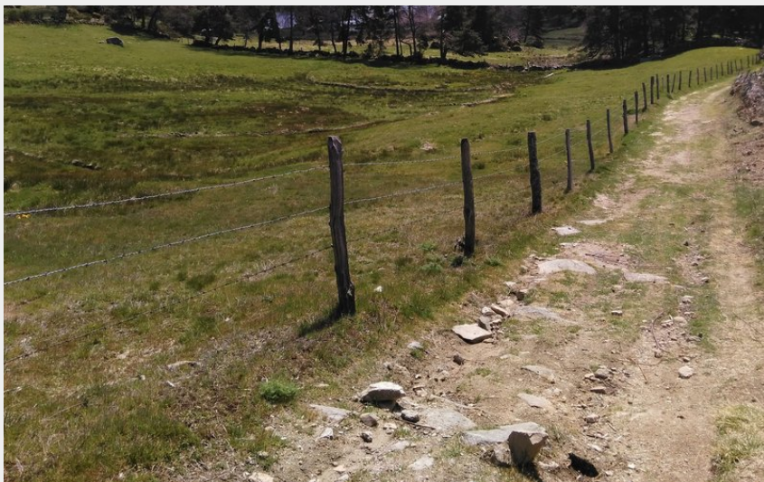
L'arrivée sur le lac du Moulinet (PNR Aubrac)