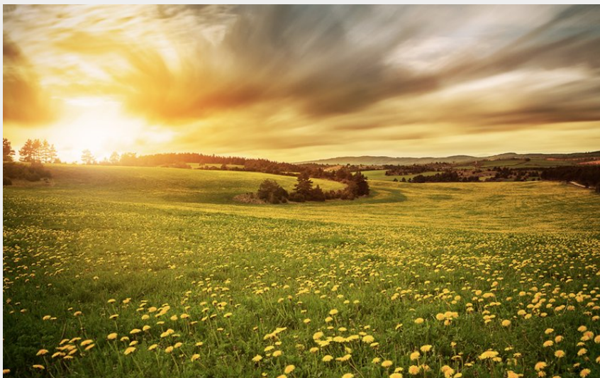
Champ sur le Causse (OTAGDT)