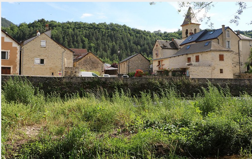
Les Salelles (OTAGDT)