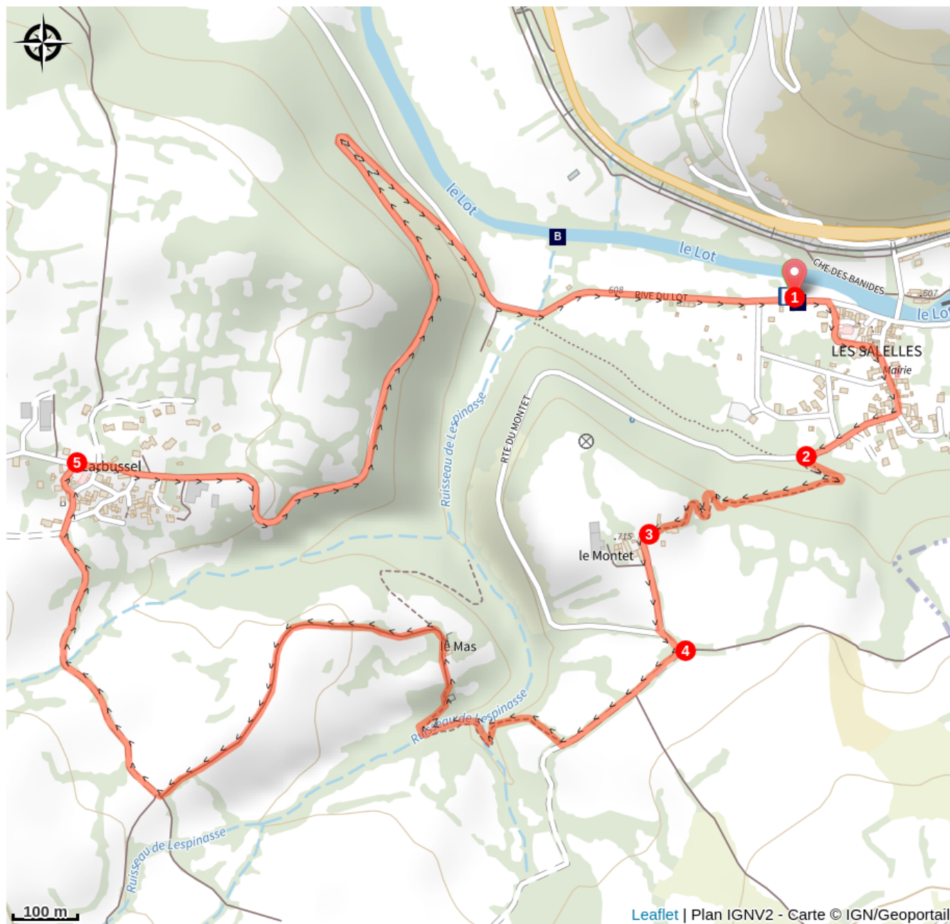
Les Salettes (A)