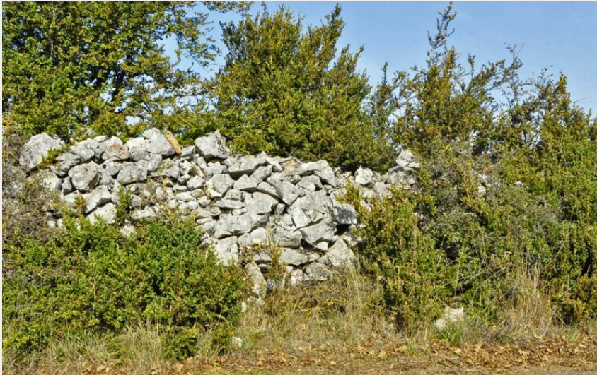
Un clapas (amoncellement de pierres) (Marie-Jeanne Citérin)