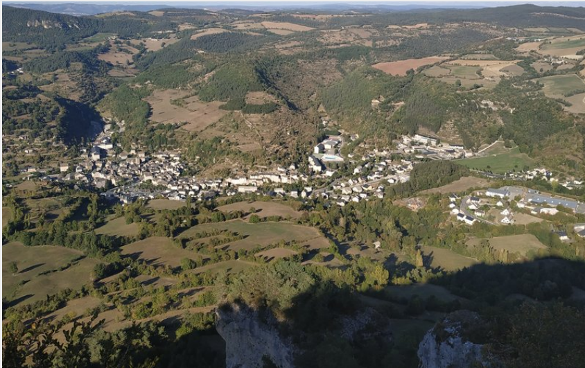
Vue sur la Canourgue