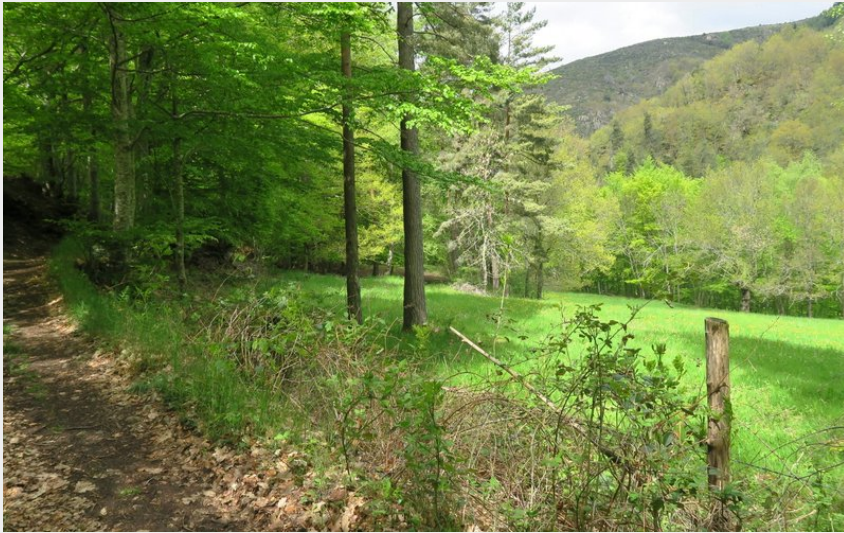
L'ambivalence du parcours entre ombrage et trouées de verdure ensoleillées (PNR Aubrac)