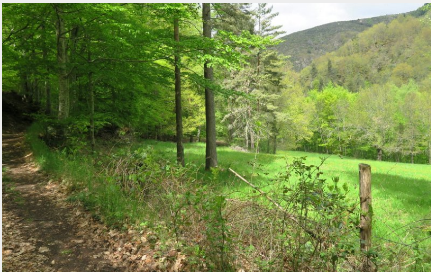
L'ambivalence du parcours entre ombrage et trouées de verdure ensoleillées (PNR Aubrac)