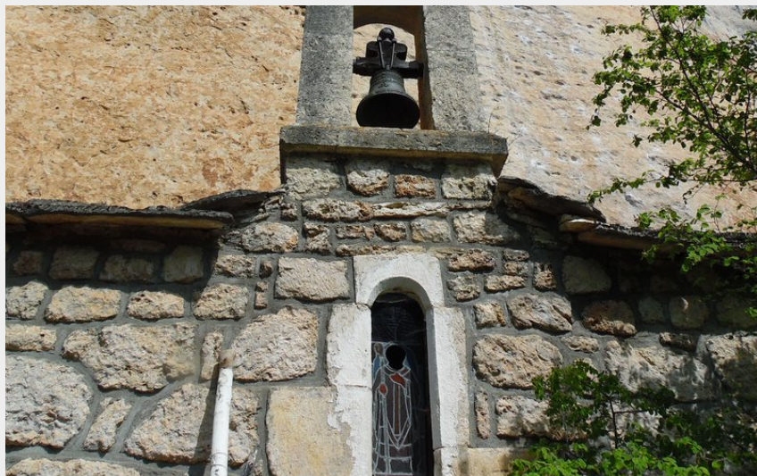
Chapelle St HILLAIRE (OTAGDT)