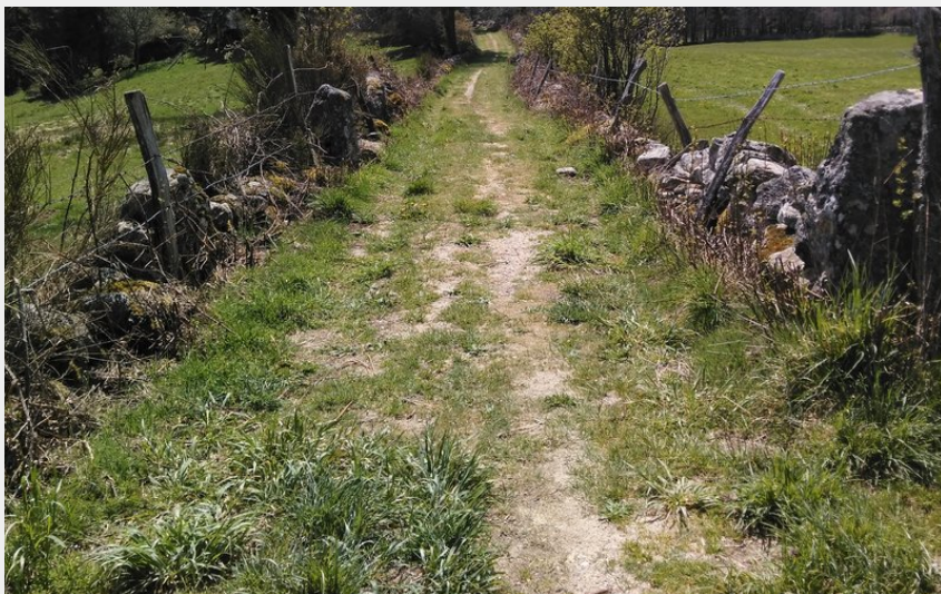
Une draille montant depuis le Lac du Moulinet (PNR Aubrac)