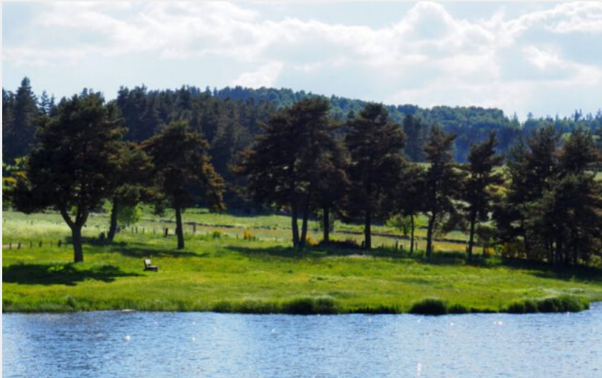
Le berges du Lac du Moulinet