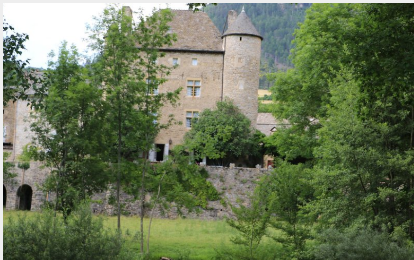
Château privé de Ressouches