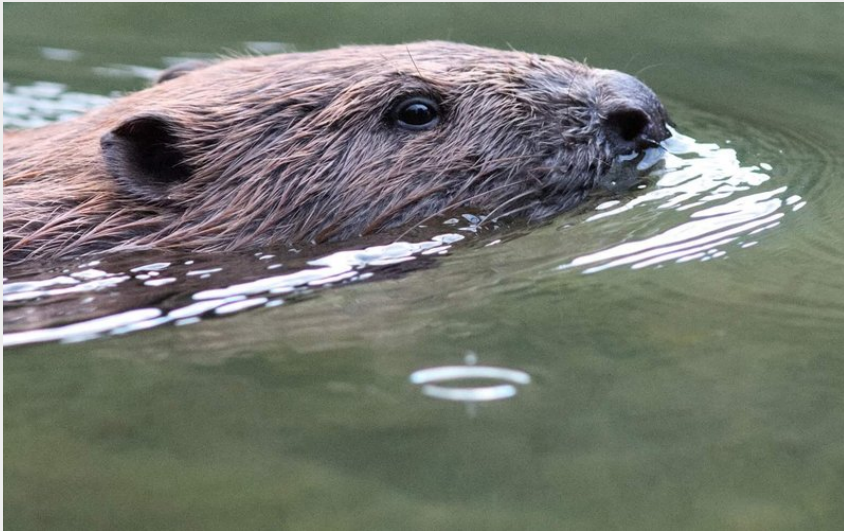
Loutre dans Tarn (OTAGDT)