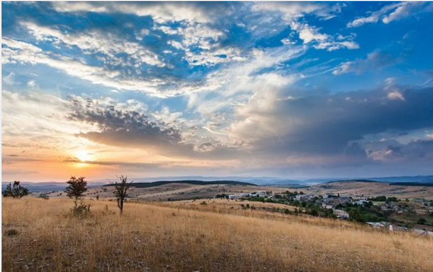
Causse de Sauveterre (com com ALCT)