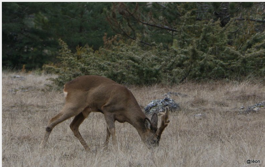
Chevreuil en velours (Léon Trocellier)