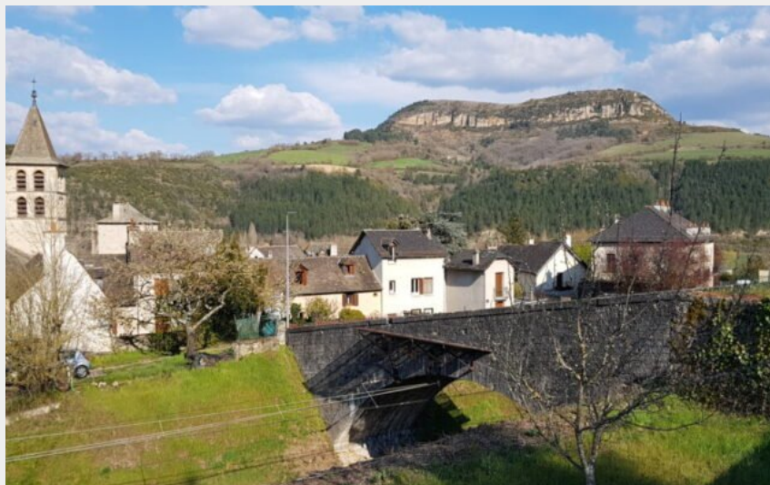
Le truc de Saint-Bonnet depuis Chirac