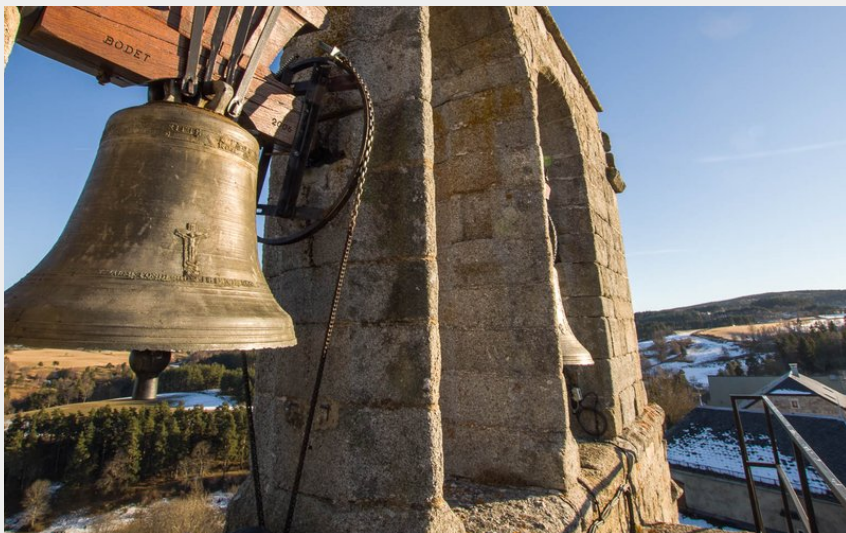
Clocher de l'église d'Albaret-Ste-Marie