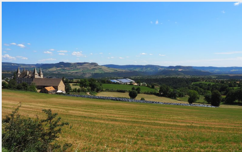
Antrenas_vues depuis le village