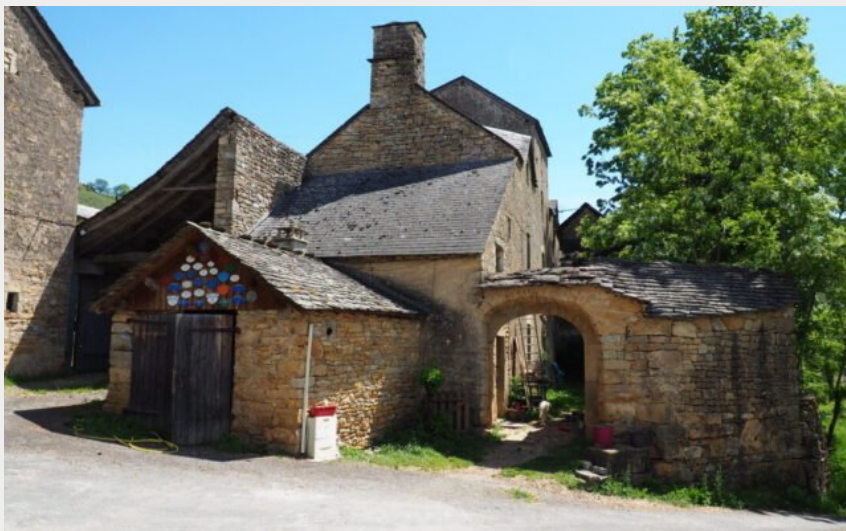
Un des hameaux sur le Truc de Saint-Bonnet