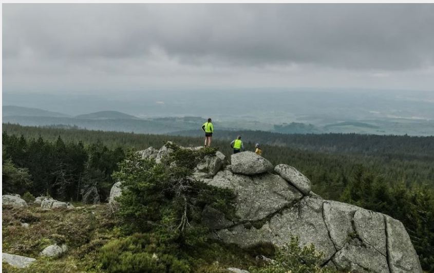
Pause contemplation (Aurélien Desmiers)