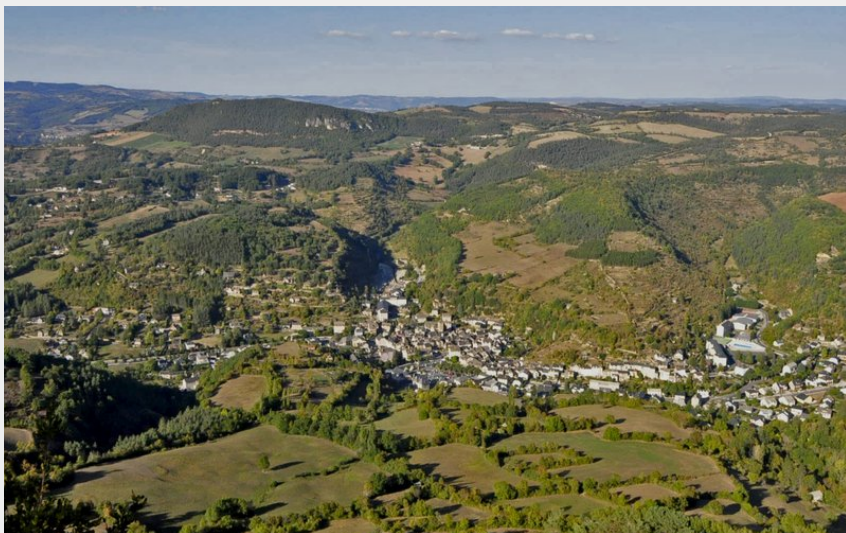
Vue du Rocher de Roqueprins