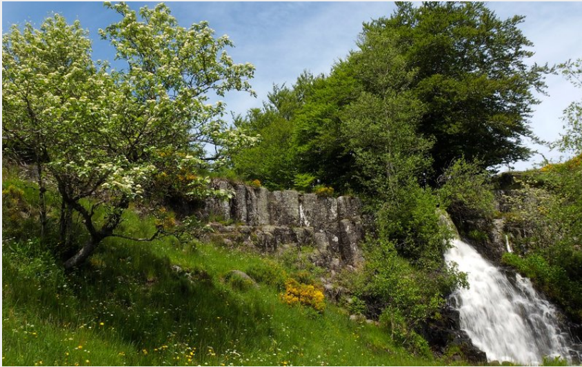
La cascade du Saltou (OT de l'Aubrac aux Gorges du Tarn)