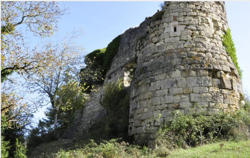
Ruines du château de Montferrand