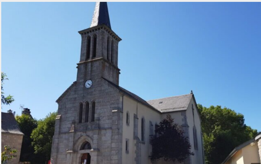
L'église de Saint-Laurent-de-Muret