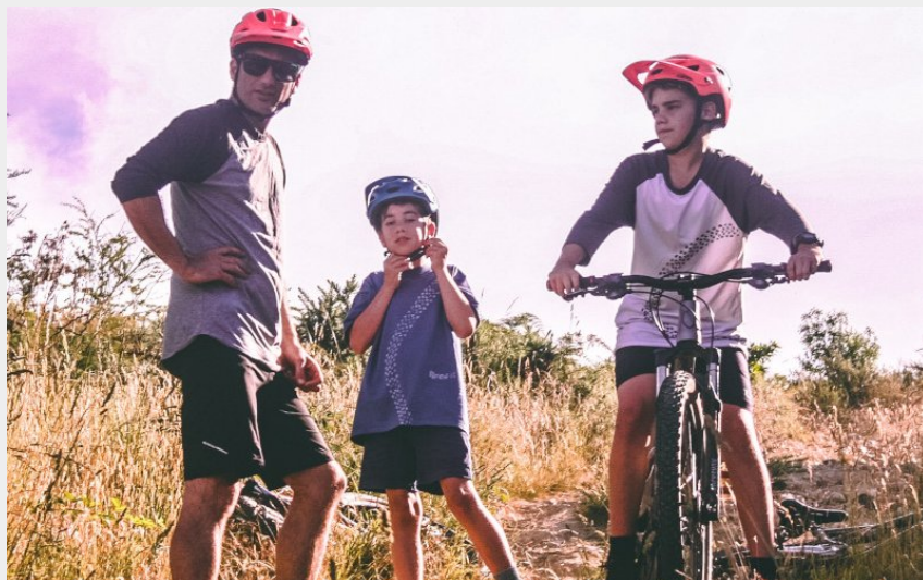
vtt famille