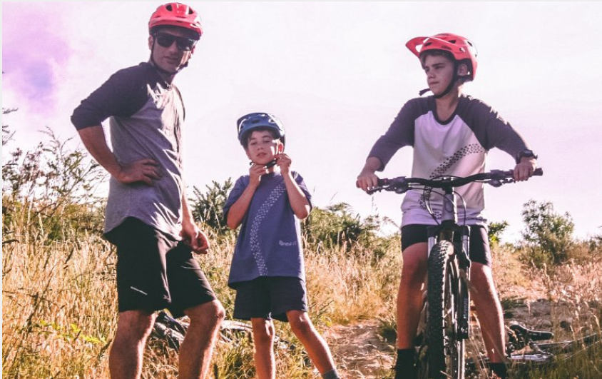
vtt famille