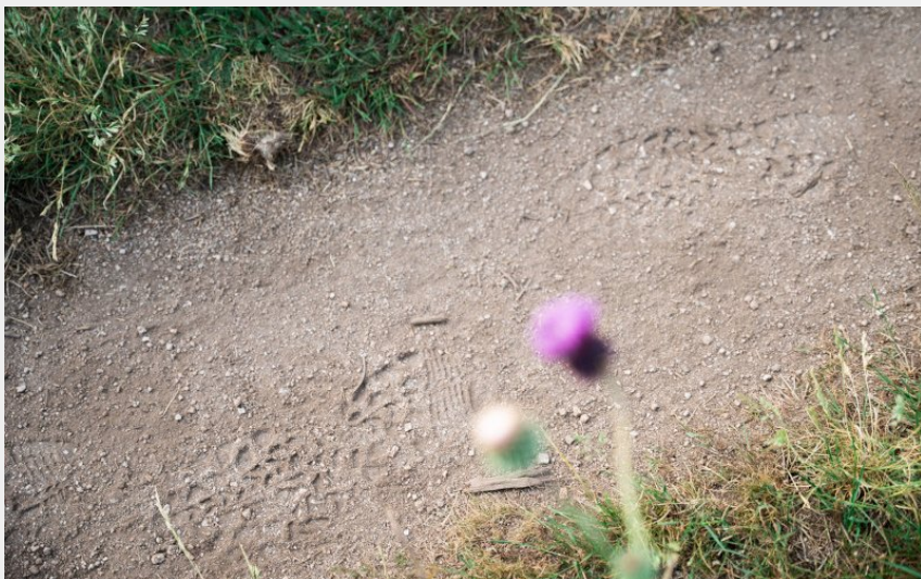
(SMAML PPN Antonin Michaud Soret Ahstudio)