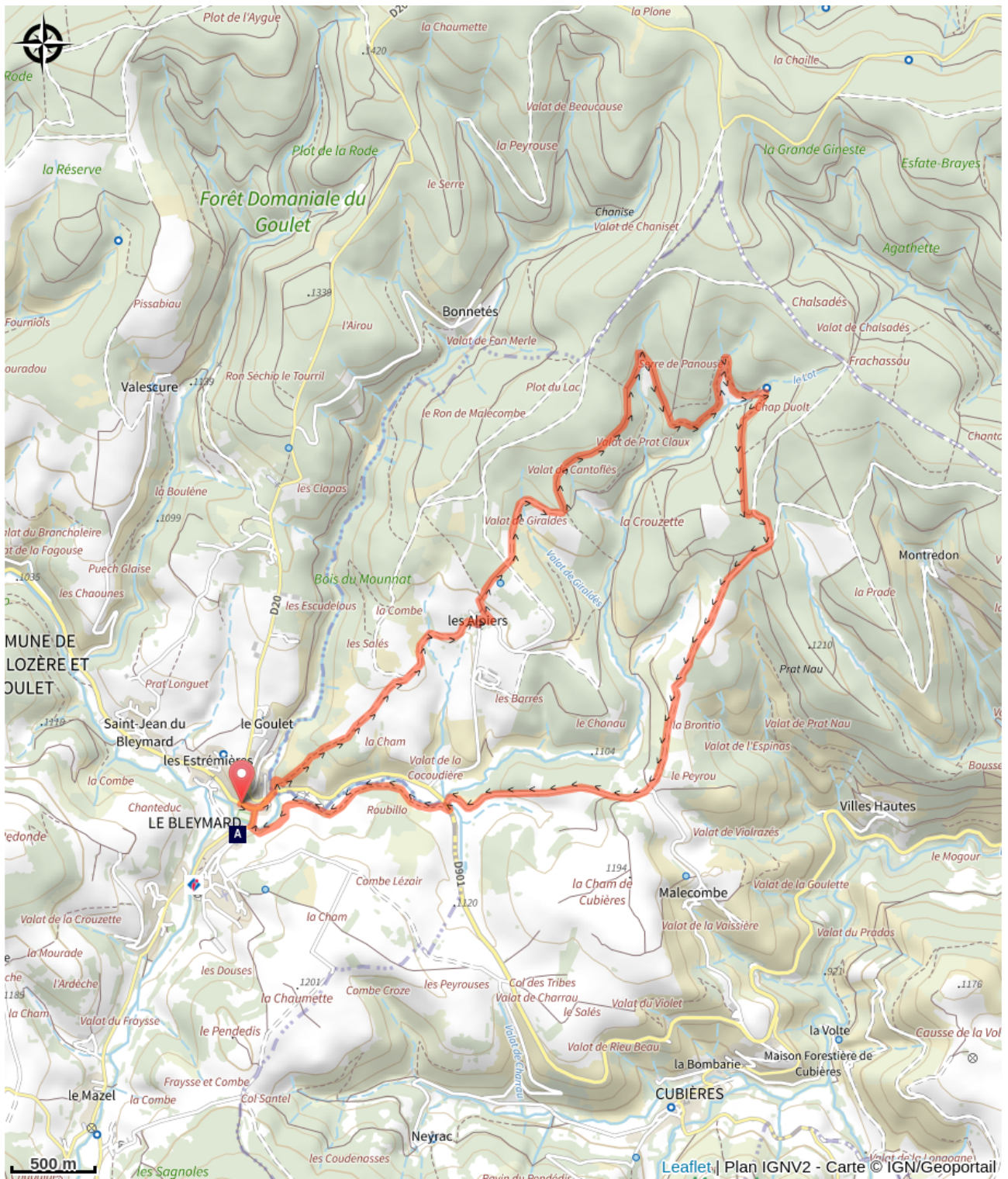
La croix des Missions (A)