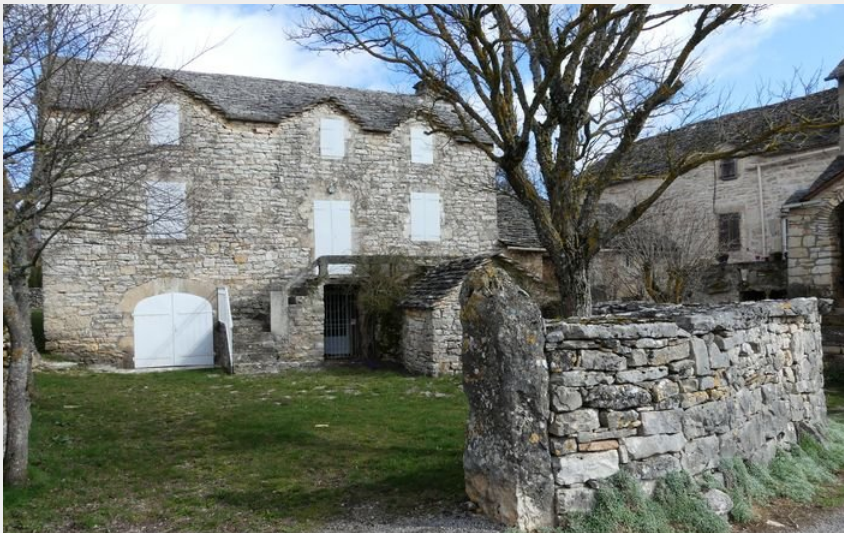
Le village d'Anilhac (nathalie.thomas)