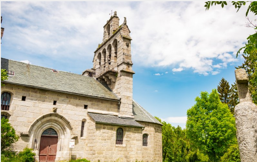
Eglise de Blavignac (Ludo Visuel)