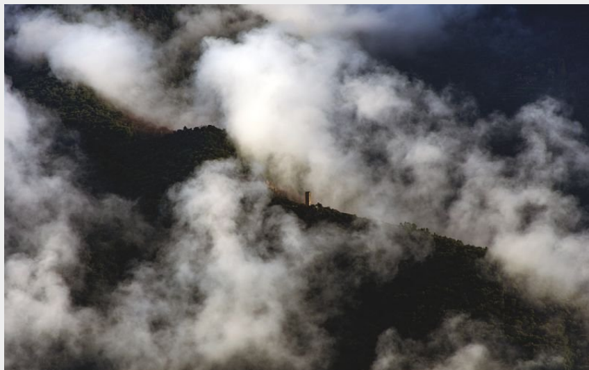
Tour du Canourgue, vallée Française