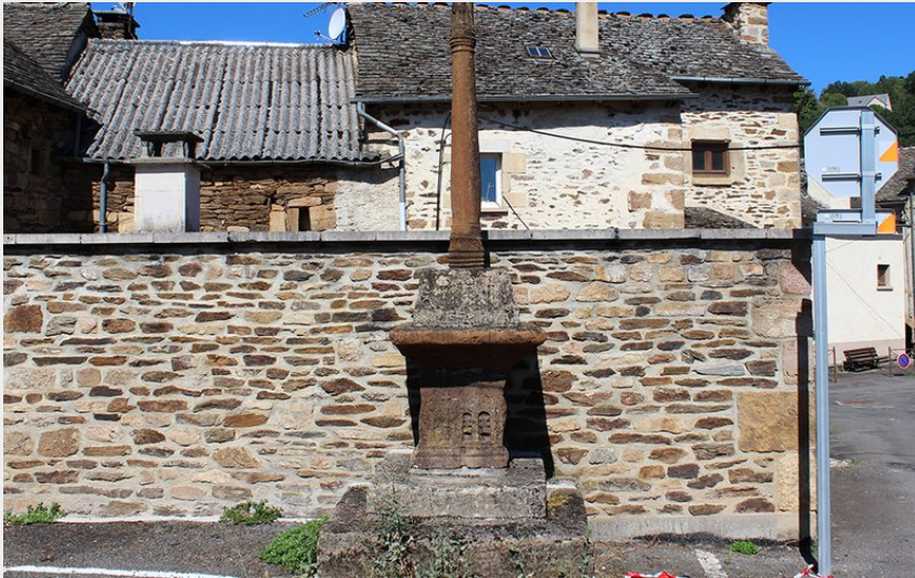
Croix remarquable à Badaroux (48) (FS - OTI Mende)