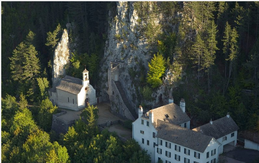
Ermitage Saint-Privat vue du Ciel