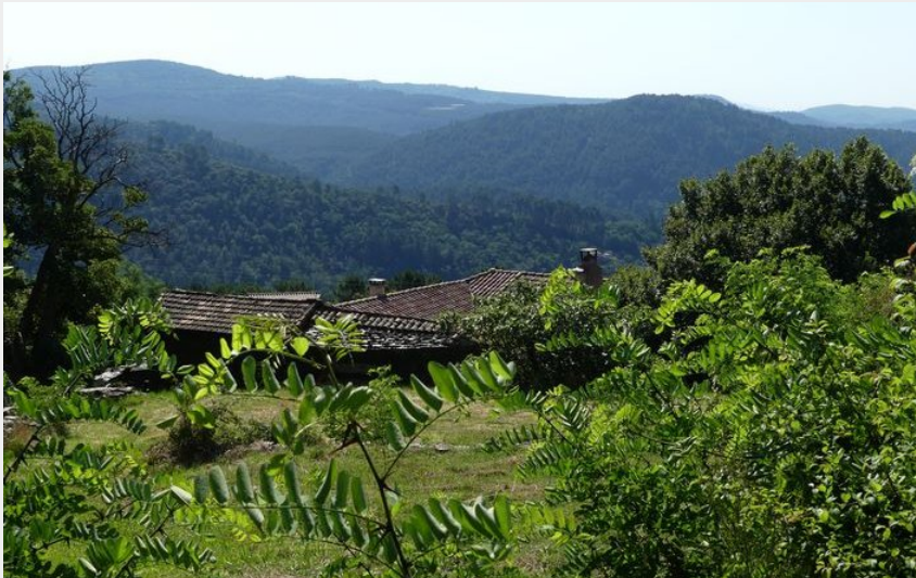
St Julien des Points (N Thomas)