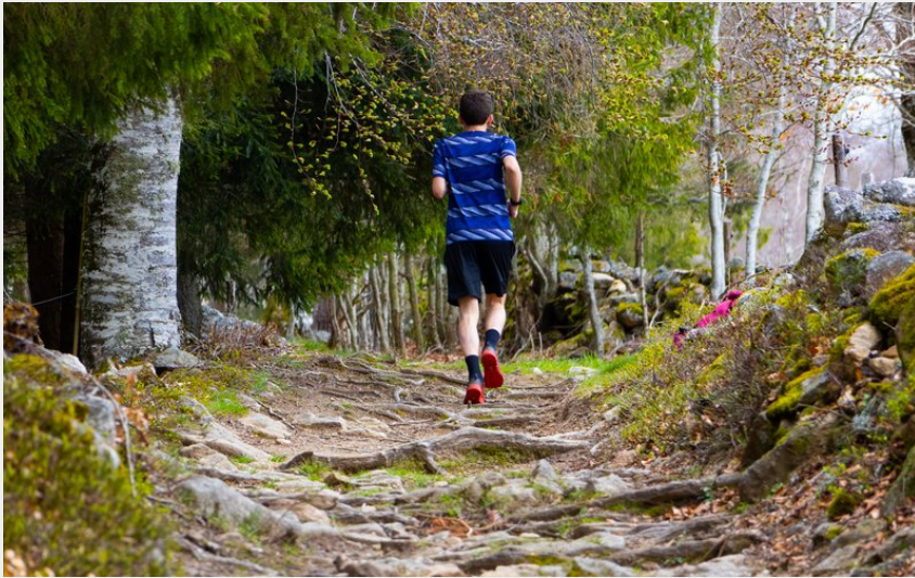
Montez en altitude ! (OT Aubrac Lozérien)