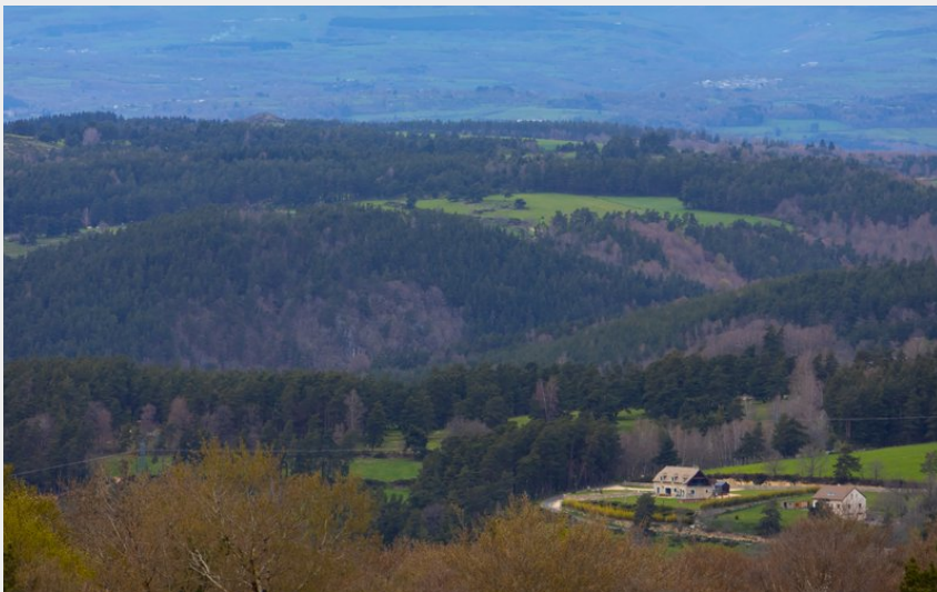
Point de vue sur le Plomb du Cantal (OT Aubrac Lozérien)