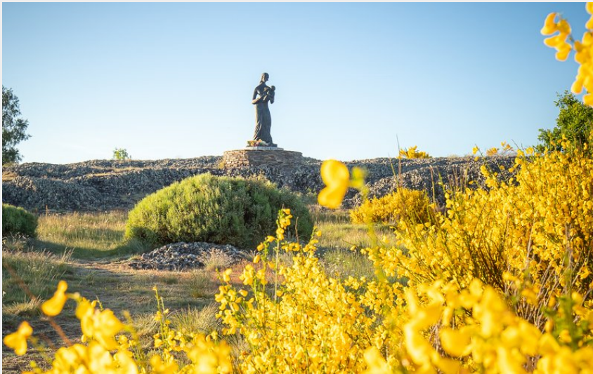
(B. Colomb - Lozere Sauvage pour PACT Aubrac)