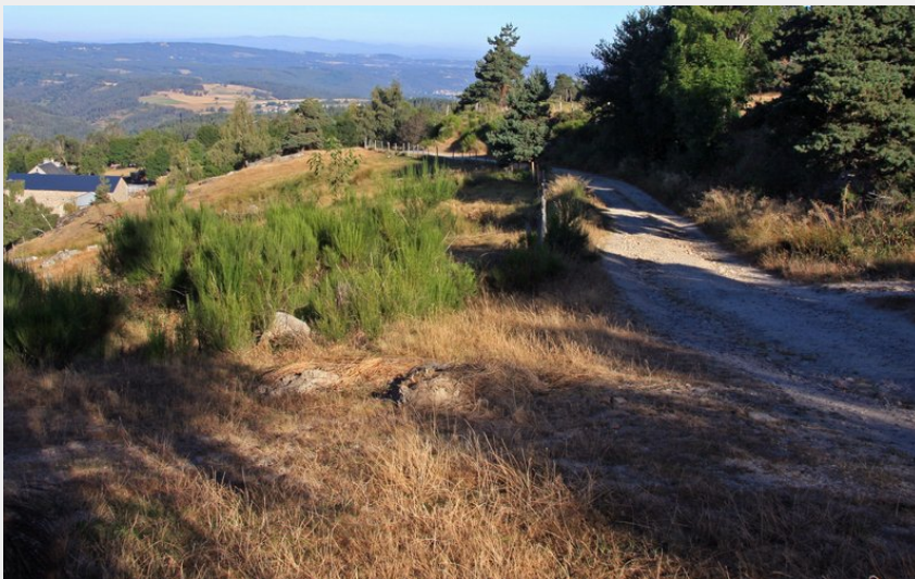
Arrivée sur le village de Saint-Alban-sur-Limagnole (OT Margeride en Gévaudan)