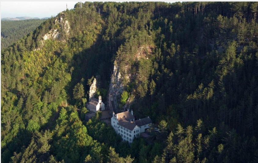
Hermitage Saint Privat