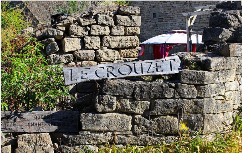
village du Crouzet