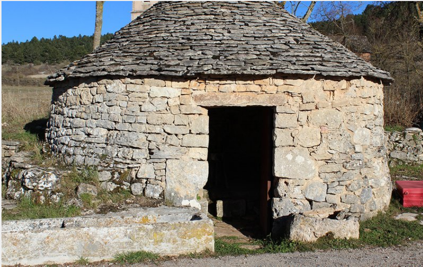
Puit dans le village du Falisson