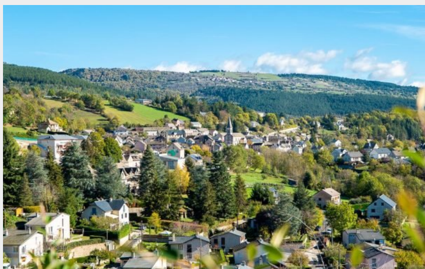
Vue sur Badaroux