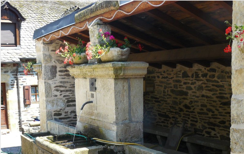
La fontaine du Mas, au Nord de Mende